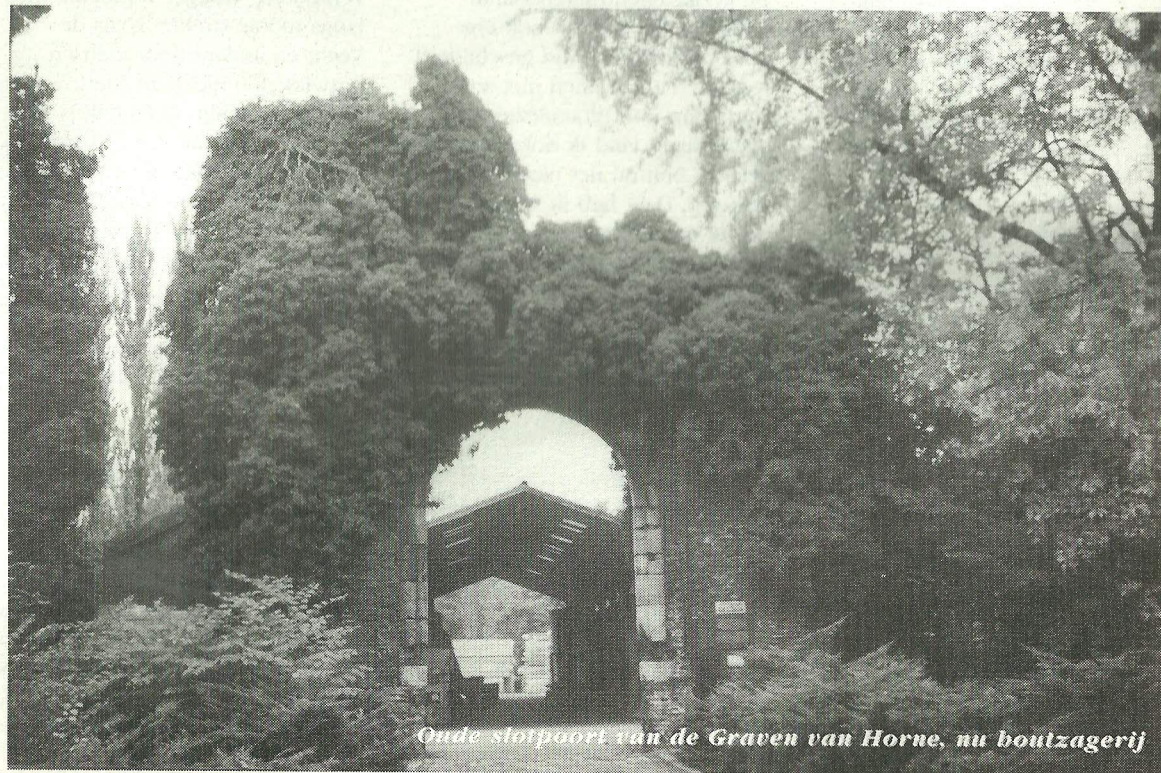
Oude slotpoort van de Graven van Horne, nu boutzagerij

Tot vijftig jaar geleden was het een dicht, oud bos. Tegenwoordig overheerst de nieuwe aanplant, maar het Weerterbosch is nog altijd met afstand het wildste bos in de wijde omgeving. Waterlopen doorsnijden het. Met name op de minder toegankelijke stukken vind je nog oud bos. Aan een langsfietsende man vraag ik de weg naar het Grenskerkmontument. 'Ik zag je net al staan', begint de man. Zoals de dieren in een bos je opmerken zonder dat jij hen ziet, en zoals in een dorp iedereen je ziet, zonder dat jouw onwennige blik die van hen ook maar een keer kruist. Ook ik zag bijna niemand en keek toch goed om me heen. 'Vader Piet' is hier geboren en getogen en kent het bos van buiten. Nu is hij WAO-er en natuurschilder, 'liefst eenden en herten, dat verkoopt beter dan een kever?' Hij