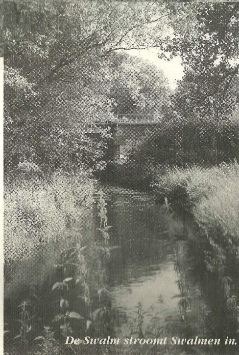
De Swalm stroomt Swalmen in.

hoe jonger. De langgerekte, door water uitgestreken, stukken land lijken op terrassen, vandaar de benaming 'terrassenlandschap'. Een groot probleem is dat het gebied stukje bij beetje wordt aangevreten. Aan de Duitse kant van Swalmen liggen bruinkoolgroeves die grootscheeps ontwateren en ook de boeren aan de Nederlandse zijde dragen bij aan een verdroging van de hoger gelegen delen. De beken die met redelijk grote hoogteverschillen uit de terraswanden kwamen sijpelen, hebben ingeboet aan kracht en leven, en zo zijn flora en fauna verder verschaald.