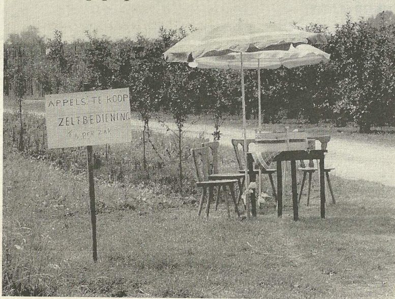
Zelfbediening op 't platteland

Na een kaal stuk dat ik had willen missen, volgt de in de NS-routebeschrijving zo geprezen oude molen die uitkijkt op de Maas. Inderdaad mooi, maar de aangrenzende dijk- en grondwerkzaamheden maken er een bouwput van. Daarachter spoedt zich een overwoekerd paadje de wildernis in. Ik betreed het oeverreservaat en daar zijn de steekvliegen, vlinders en muggen terug van weggeweest, en hoe! In zwermen komen ze op me af. Mijn voeten soppen door het water.